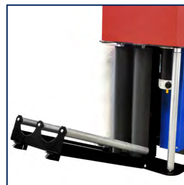
System rozciągania folii (opcja)