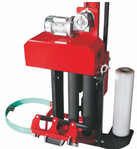
System Power pre-stretch (w standardzie)